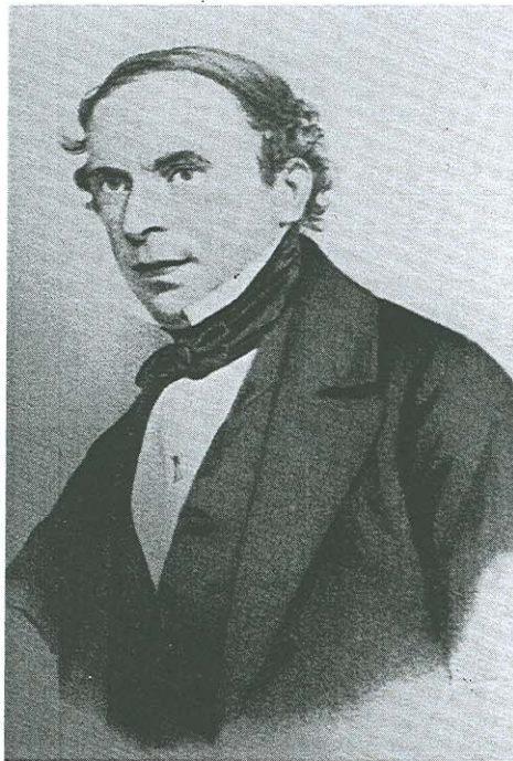
Der Rheinländer Ludolf Camphausen (oben) wurde vom

Aus den unlängst in Heinsberg gefundenen Dokumenten — sechs Prozeßakten gegen Freiligrath, Lassalle und Marx mit insgesamt 550 Blatt — läßt sich das Ringen um den Kurs der Revolution bis ins Detail genau verfolgen: Während Freiligrath, Marx und Engels, die erst im April und Mai aus belgischer und britischer Emigration zurückgekehrt waren, von Anfang an auf die